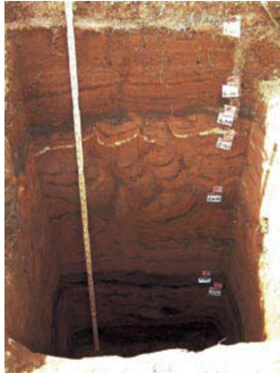
Mynd 2. Gjóskulög eru mjög skýr á rannsóknarsvæðinu á Skriðu. Myndin sýnir snið sem tekið var þar.