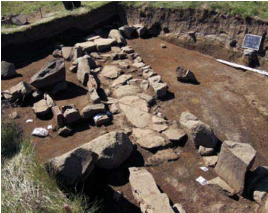
Mynd 3. Hellulagður gangur austast í byggingu Skriðuklausturs. Klaustrið var allt byggt úr torfi, grjóti og rekaviði.

undir grasrótinni voru leifar áður óþekktra bygginga sem náðu yfir a.m.k. 1300 fermetra stórt svæði og lágu þær að kirkjurústinni. Þær voru frá ætluðum klausturtíma, 1493–1554. Stuðst var við gjóskulagatímatalið við aldursgreiningar á þeim en mjög skýrt gjóskulag er þarna úr gosi sem varð á Veiðivatnasvæðinu í Vatnajökli árið 1477, tæpum tveimur áratugum áður en klaustrið var stofnað (mynd 2). 8