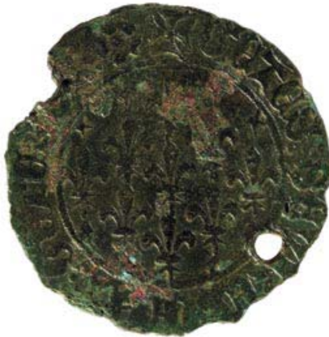
Mynd 6. Reiknimynt, skreytt frönskum sverðliljum, fannst nyrst í byggingu Skriðuklausturs. Reiknimyntir voru m.a. notaðar til þess að reikna út tíundagreiðslur.

Kvillar þessir og sjúkdómseinkenni á beinagrindunum benda til þess að spítali af einhverju tagi hafi verið rekinn í klaustrinu, líkt og gjarnan var gert í klaustrum í öðrum löndum. 18 Þessu til staðfestingar hafa við uppgröftinn fundist sautján áhöld til lækninga, auk þess sem frjókornagreiningar sýna fram á að þar hafi verið ræktaðar lækningajurtir, samhliða annarri garðrækt. Læknisáhöldin eru einkum bíldar, skurðarhnífar og þrjónar sem notaðir voru til að loka sárum og skurðum. 19 Einn lyfjabaukur úr leir hefur einnig fundist og tvö lyfjaglös úr gleri.