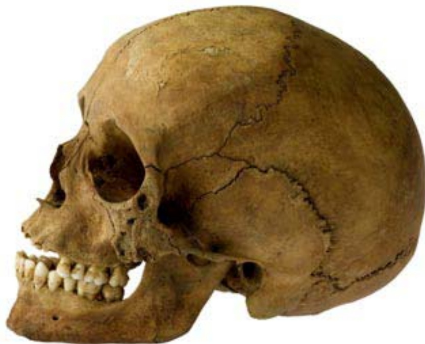
Mynd 5. Einkenni sárasóttar hafa verið greind á nokkrum beinagrindanna frá Skriðuklaustri. Sjá má sýkingu í kinnbeini hausúpunnar.

Rétt er að geta þess að klausturkirkjan var ekki vígð fyrr en 1512, tæpum tveimur áratugum eftir að klaustrið var stofnað, en klausturhald leið síðan undir lok um 40 árum síðar. Af varðveittum skjölum kemur fram að árið eftir vígslu kirkjunnar hafi Þorvarður príor Helgason gert mikil jarðakaup sem hann skuldbatt sig til að greiða í lausafé á tæpum tveimur árum. 16 Hvort kaupin hafi haft áhrif á byggingu kirkjunnar er látið ósagt en þau hljóta engu að síður að hafa haft áhrif á efnahag klaustursins og getu til þess að standa í frekari húsbyggingum.