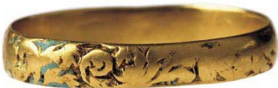
Mynd 10. Gullhringur. Fannst í gröf við kór kirkjunnar á Skriðuklaustri.

voru klæddar í leðurkápur sem voru skreyttar með býsönsku munstri (mynd 9). Ein þessara grafa, sem fundust inni í kirkjunni, bar af öðrum. Í henni hafði karlmaður á miðjum aldri verið jarðaður í skósiðum kuflum sem var ofinn úr ull með þráðum úr bronsi. Bein sýkra einstaklinga hafa einkum fundist í klausturgarðinum sjálfum en dánarorsök þeirra sem hlutu leg innandyra er óljós.