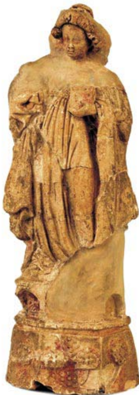
Mynd 7. Líkneski af heilagri Barböru.