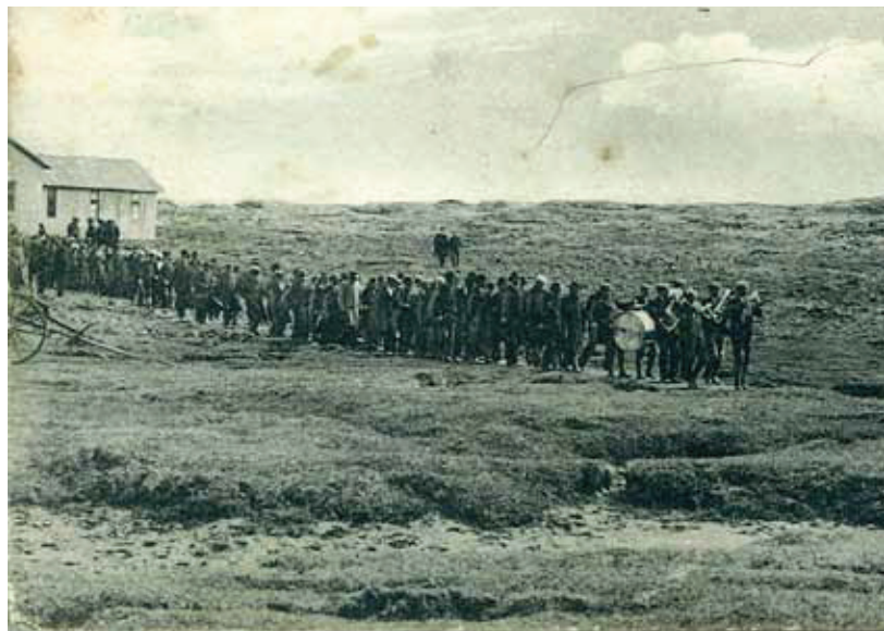
Íslendingar fylktu oft liði undir hvítbláa fánanum á fyrsta áratug aldarinnar.

Í lítilli varningsbók varaði Jón einnig sterklega við því að nokkrar hömlur væru settar á verslunina að frumkvæði landsmanna sjálfra og nefnir þar sérstaklega til sögunnar hugmyndir um að banna þeim kaupmönnum að versla héraðs sem ekki eigi lögheimili á Íslandi. En slíkar hugmyndir flögðu töluvert um á Alþingi á síðari hluta níttjándu aldar. Það var því kannski ekki að ófyrirsynju að Thomsens Magasin birti stóra auglýsingu í blöðum í tengslum við verslunarfrelsis-afmælið árið 1904 með feitletruðum stöfum „Thomsens verslun er innlend, ágóðinn verður kyr í landinu.“ Var síðan talið hvað verslunin hefði greitt í laun, viðhald og svo framvegis.