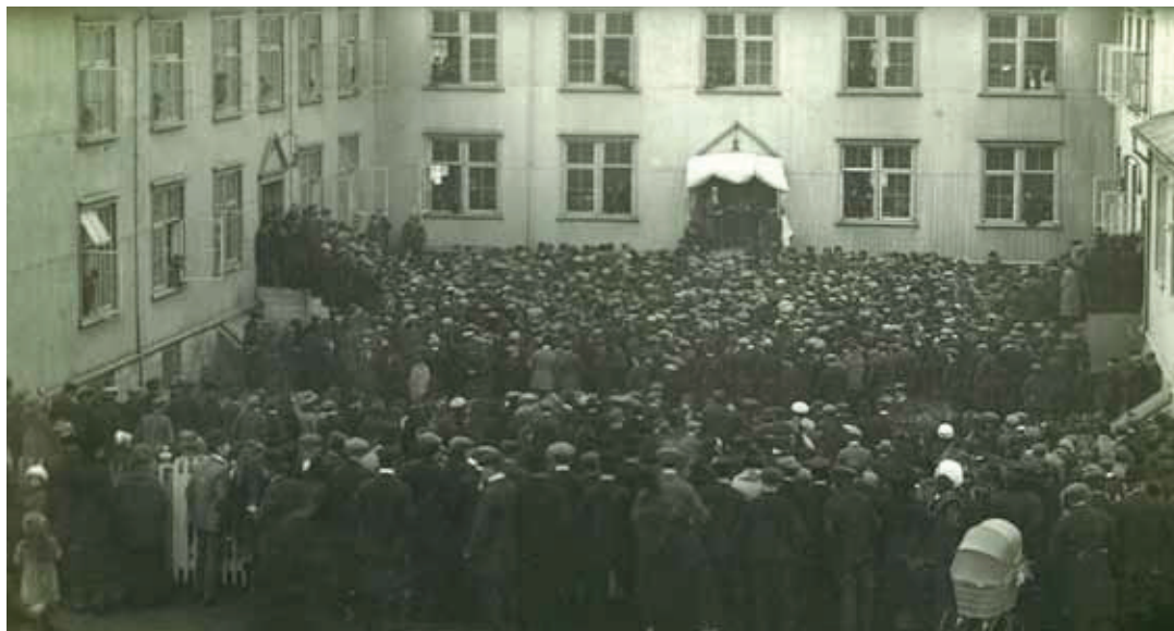
Frá fundi við Miðbæjarskólann í Reykjavík í upphafi 20. aldarinnar. Íslendingar börðust harkalega fyrir frelsi þjóðarinnar en óttinn við viðskiptafrelsi kemur upp aftur og aftur, og birtist þá sem hagsmunagæsla, verndarstefna, þjóðremba, lýðskrum eða eitthvert afbrigði af hugmyndafræði sem hampar jafnrétti og bræðralagi í því skyni að réttlæta frelsisviptingu til athafna.

þjóðfélagsbreytinga sem lögðust illa í landsmenn. Þar mætti nefna þéttbýlismyndun, byggðaröskun og fleiri sviptingar sem fylgdu breyttum atvinnuháttum.